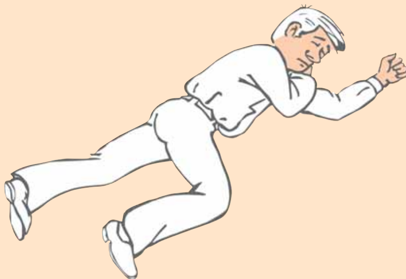
Posición de seguridad.